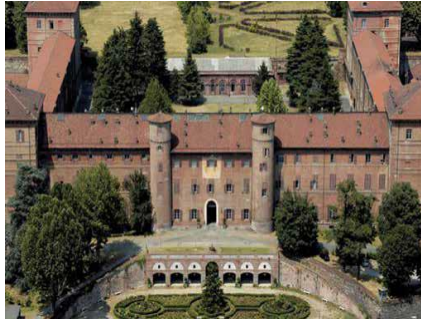
Ingresso in Viale del Castello, 2, Moncalieri